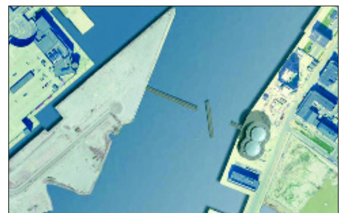
Den kommende Bryggebro mellem Havneholm og Islands Brygge bliver en 190 meter lang og 5,5 meter bred svingbro, som skal kunne åbnes for større skibe ved at et af brofagene svinger til siden. (Visualisering: Københavns Kommune)

Den kommende Bryggebro bliver en 190 meter lang og 5,5 meter bred svingbro, som skal kunne åbnes for større skibe ved, at et af brofagene svinger til siden. Broen giver cyklister og fodgængere mulighed for at krydse vandet sikkert og hurtigt. Det forventes, at den bliver til gavn for lokalområderne på begge sider, idet beboere på Islands Brygge får nem adgang til indkøbsmuligheder og S-togsforbindelser, mens be-