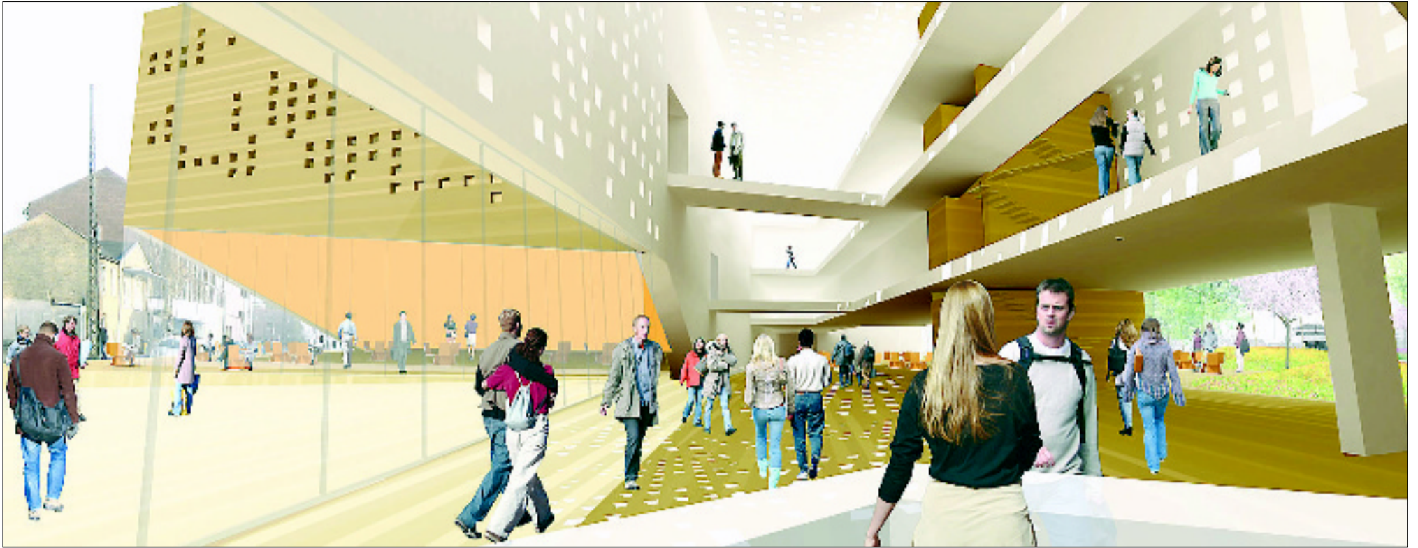
Hos tre.d er det arkitekter, som visualiserer arkitektur. Og kombinerer det bedste fra 3D-industrien med baggrunden som arkitekter. Her er det CVU på Nørrebro i København, der er visualiseret af tre.d.